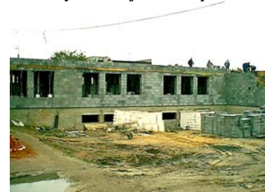
widok od placu szkolnego

● aktualny serwis fotograficzny z budowy Gimnazjum w Ciepiewie