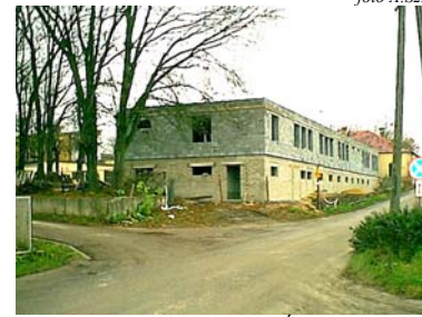
widok od strony drogi na Świesielce