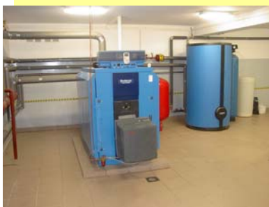
nowoczesna, bezobsługowa kotłownia olejowa

Na pierwszej sesji Rady Gminy w dniu 18 listopada 2002 roku, rada powołała komisję do spraw odbioru gimnazjum w Ciepeliowie. W wyniku prac komisji, postanowiono dokonać kilku przeróbek adaptujących dotychczasowy budynek do potrzeb użyteczności gimnazjum. Między innymi postanowiono o zaadaptowaniu zaplecza kuchennego na kuchnię o odpowiednich parametrach. Ostatecznie dokonano odbioru części modernizowanej ( budynek od rynku) z zastrzeżeniem wykonania prac przez wykonawcę w okresie sprzyjającym pogodowo ( poprawa elewacji budynku, a więc prace które nie zostały w pełni wykonane w związku z nadejściem zimy). Na dzień 29 stycznia zaplanowano ostateczny odbiór całego gimnazjum.