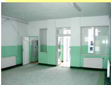
wejście główne do Gimnazjum „od środka”