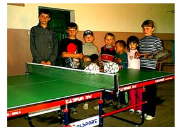
dzieci i młodzież z Kunegudnowa